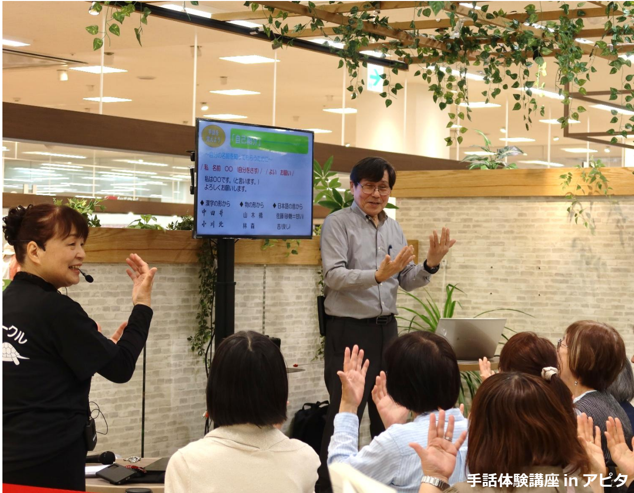
手話体験講座 in アピタ