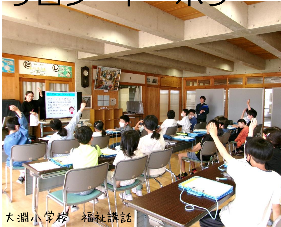
大淵小学校 福祉講話