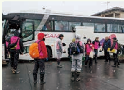
足利市社協のボランティアバス