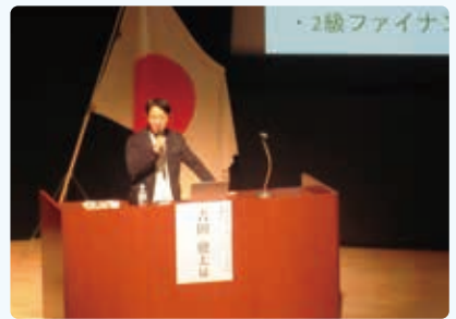
社会福祉推進講演会