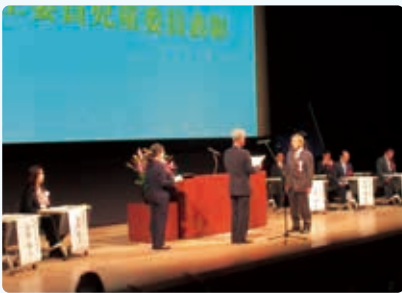
社会福祉功労者表彰