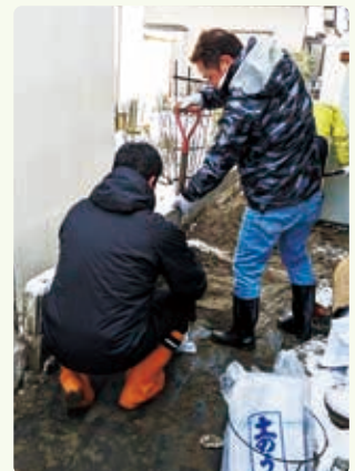
泥出し作業の様子