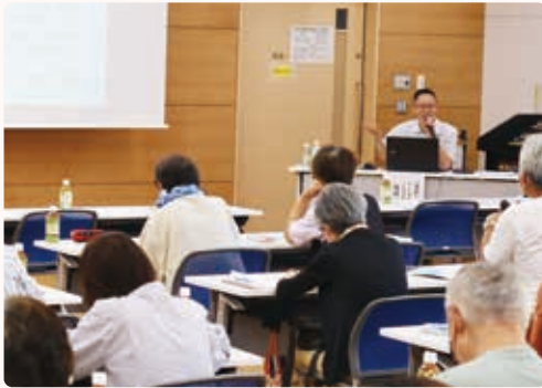
R5 年度講演会の様子