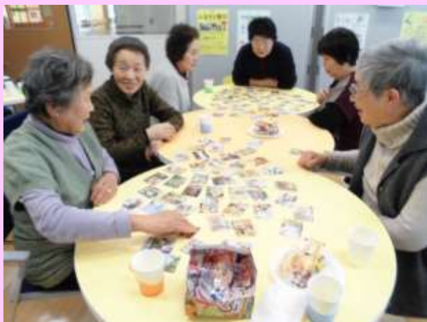
2/19 (金) @ボランティアサロン