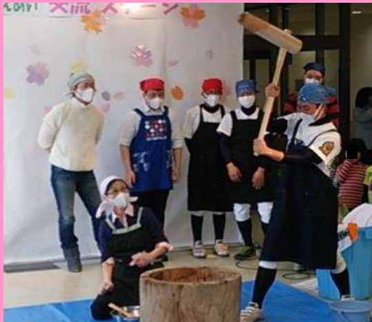
4/20 (日) 江南区ふれあい・ささえあい交流事業 @亀田駅前地域交流センター